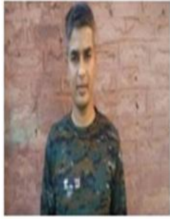
Pankaj Kumar Tripathi