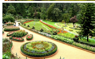
Государственный ботанический сад